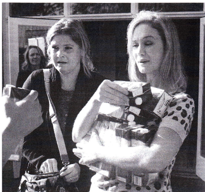
Medewerker van de Alliantie krijgt melkpakken aangeboden.